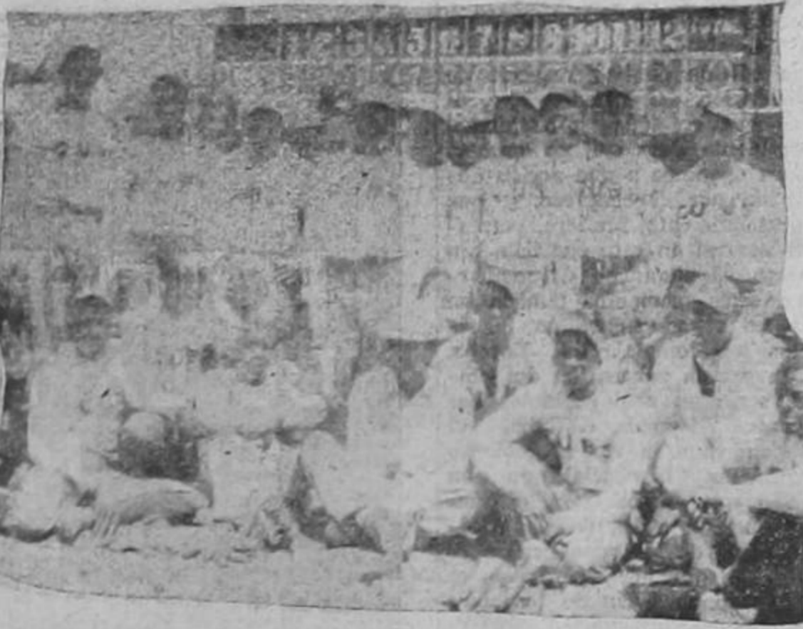
EQUIPO DE LOS "CUBS" CAMPEON DE LIMON