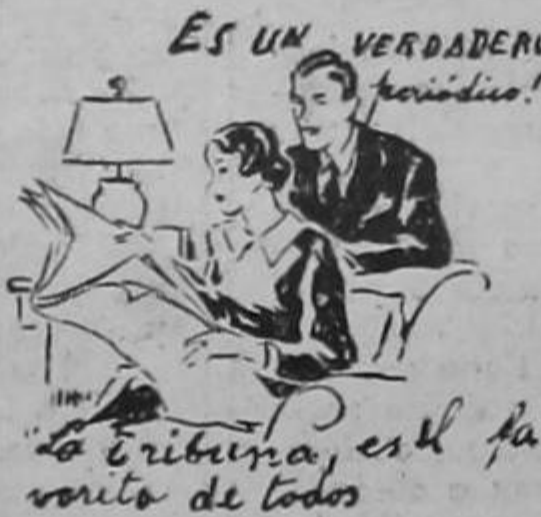
ES UN VERDADERO coisiduo! La tribuna, es el favorito de todos

En impúdicos actos con unas menores fué sorprendida una mujer. — Condenada a 60 días de prisión